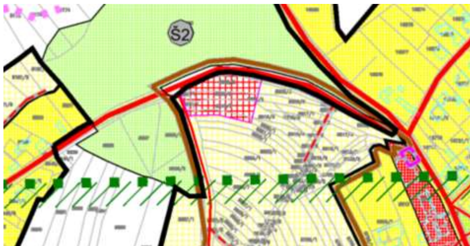
Prikaz 3 Novo rješenje područja Bukovčak južno od Ž 2006.

Izmjena ne utječe na izmjenu površine neizgrađenog i neuređenog područja naselja Selnica, pošto su obje namjene utvrđene kao neizgrađeno i neuređeno građevinsko područje za koje je utvrđene obveza izrade prostornog plana užeg područja, u ovom slučaju primjena Detaljnog plana uređenja područja Bukovčak u Selnici.