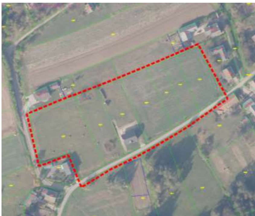
Prikaz 1 Ortofotoprikaz područja – listopad 2020. i prikaz obuhvata UPU

Područje obuhvata Urbanističkog plana uređenja područja „Ograd“ u Selnici utvrđeno je Odlukom o izradi Urbanističkog plana uređenja područja „Ograd“ u Selnici, kao zemljište katastarskih čestica brojeva od 6377 do 6383 k.o. Selnica. Predmetna Odluka je usvojena od Općinskog vijeća Općine Selnica u lipnju 2020. godine i objavljena u „Službenom glasniku Međimurske županije“ broj 10/20. Obuhvat je dodatno proširen i na zemljišnu česticu ulice Ograd u širini područja obuhvata navedenih katastarskih čestica.